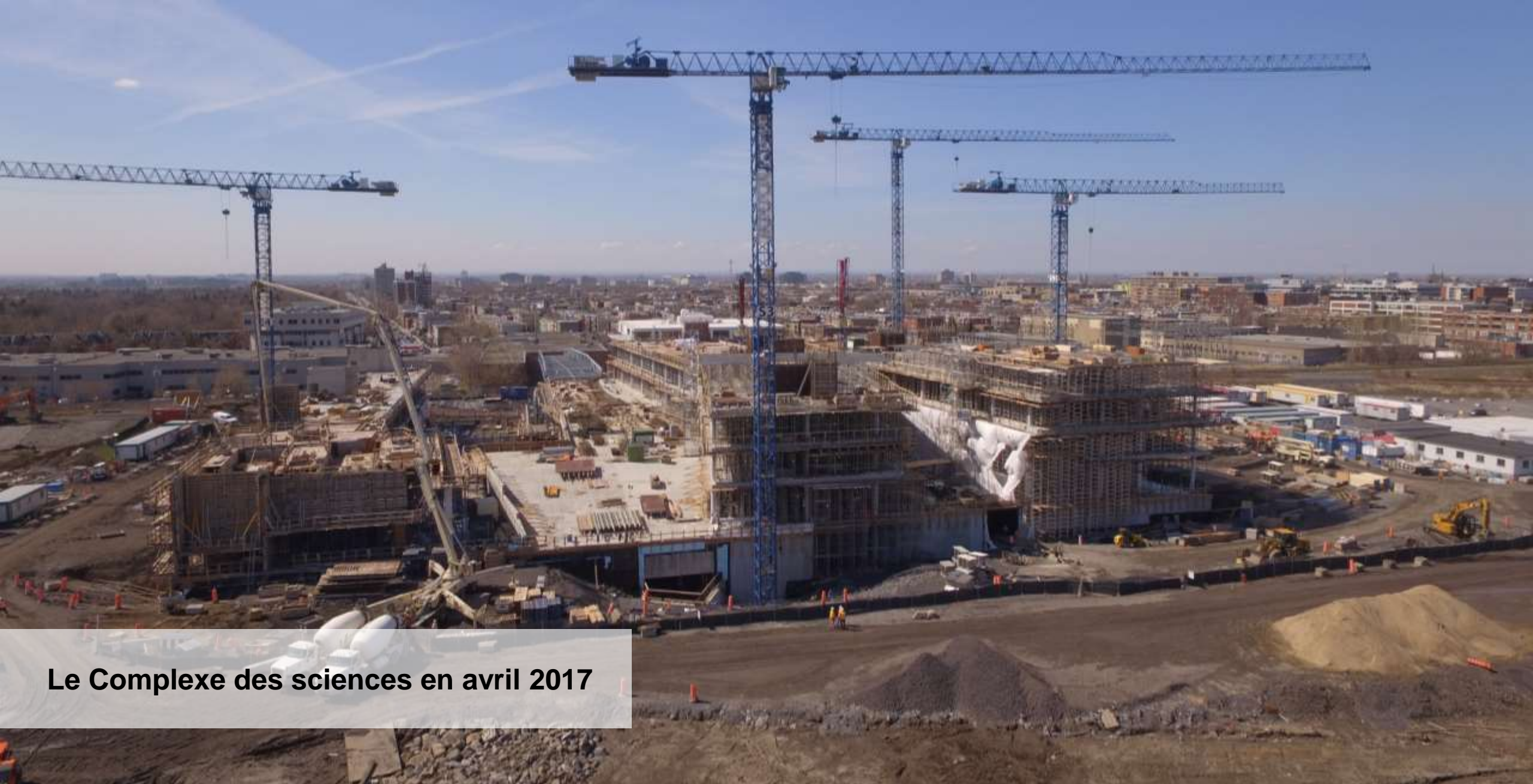
Le Complexe des sciences en avril 2017