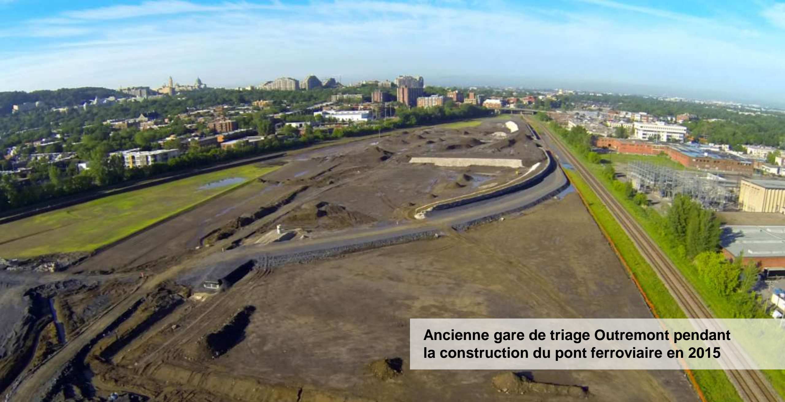
Ancienne gare de triage Outremont pendant la construction du pont ferroviaire en 2015